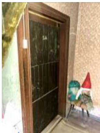
Dzīvokļa ieejas durvis