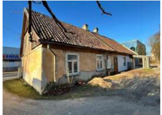
Daudzdzīvokļu dzīvojamās ēkas fasāde