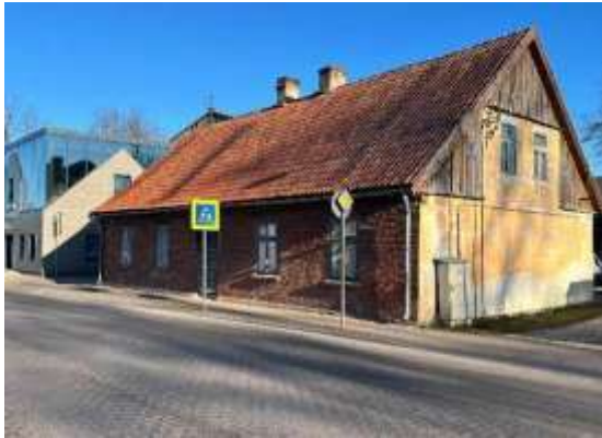
Daudzdzīvokļu dzīvojamās ēkas fasāde