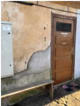
Ieeja daudzdzīvokļu dzīvojamā ēkā